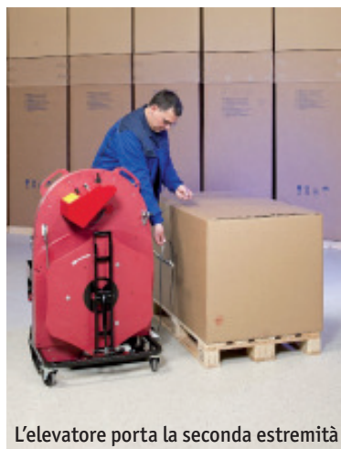
L'elevatore porta la seconda estremità

ErgoPack, al momento della consegna del sistema, si assume l'istruzione degli operatori, presso il cliente