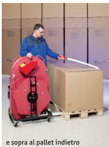
e sopra al pallet indietro