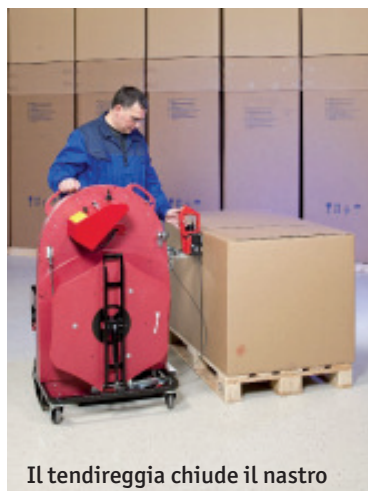
Il tendireggia chiude il nastro