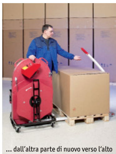
... dall'altra parte di nuovo verso l'alto

Anche gli imballi alti non costituiscono alcun problema per i sistemi ErgoPack: con un modulo aggiuntivo è possibile reggiare pallet di altezza fino a 3,0 metri, in maniera sicura e veloce.