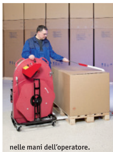
nelle mani dell'operatore.