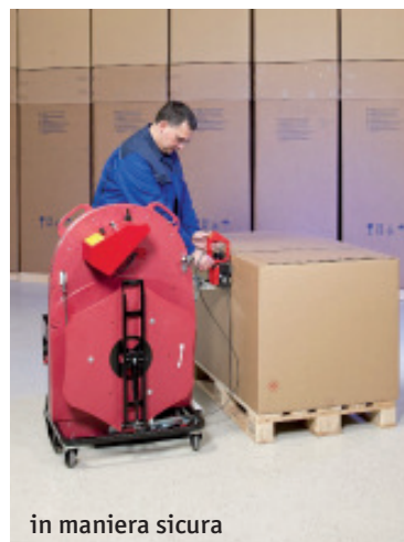
in maniera sicura

Senza chinarsi, in maniera pulita, sicura e veloce: 1 minuto per reggiare un pallet.