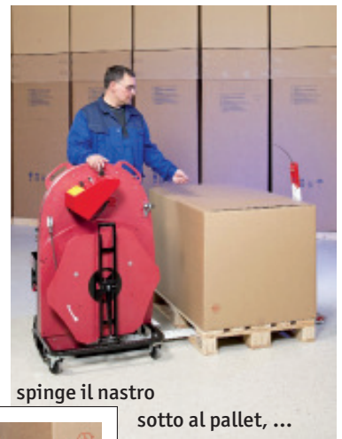
spinge il nastro sotto al pallet, ...