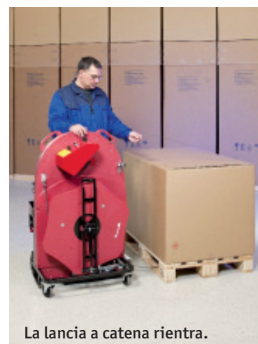
La lancia a catena rientra.