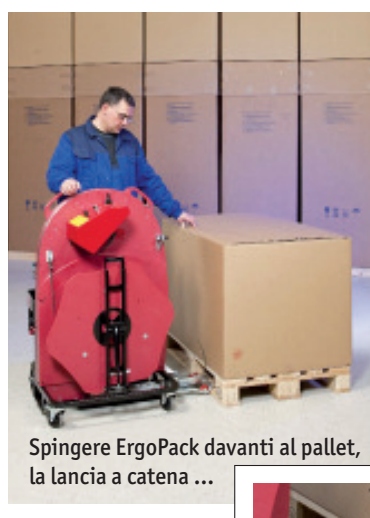
Spingere ErgoPack davanti al pallet, la lancia a catena ...