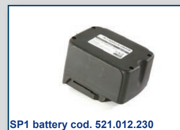
SP1 battery cod. 521.012.230